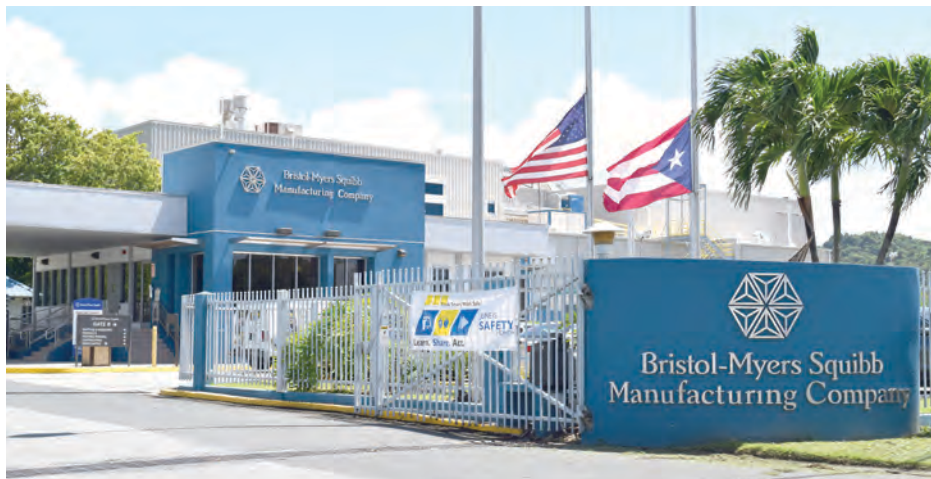
Los químicos ya no se utilizan en las operaciones de manufactura de Humacao.

"BMS ha estado trabajando por los pasados años con la Agencia de Protección Ambiental federal (EPA, por sus siglas en inglés), para realizar evaluaciones ambientales y acciones correctivas en su planta de manufactura de Humacao. Las últimas muestras recogidas dentro del límite de la propiedad indican la necesidad de información adicional sobre la condición del agua subterránea fuera de los perímetros de la planta. Las muestras recopiladas dentro de la propiedad muestran la presencia de ciertos solventes industriales", explicó Pellati