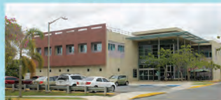
CIDRA Ave. El Jíbaro, Carr. 172 Km. 13.5