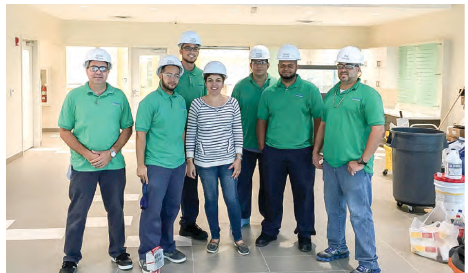
Parte del equipo de trabajo de Klinterk Maintenance