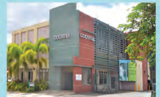
SAN LORENZO Calle Muñoz Rivera 186