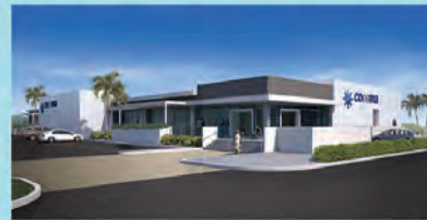
LAS PIEDRAS Parque Industrial Sur