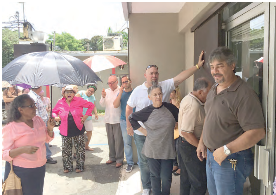
Las filas son de más de dos horas afuera de la oficina.

Ciudadanos molestos con las limitaciones de espacio en la oficina de Humacao y las largas horas de espera