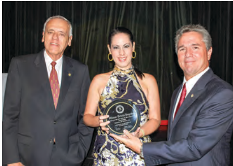
Reconocimiento a el gerente del Año 2009 de Manufactura Región Este, Asociación Industriales de PR.