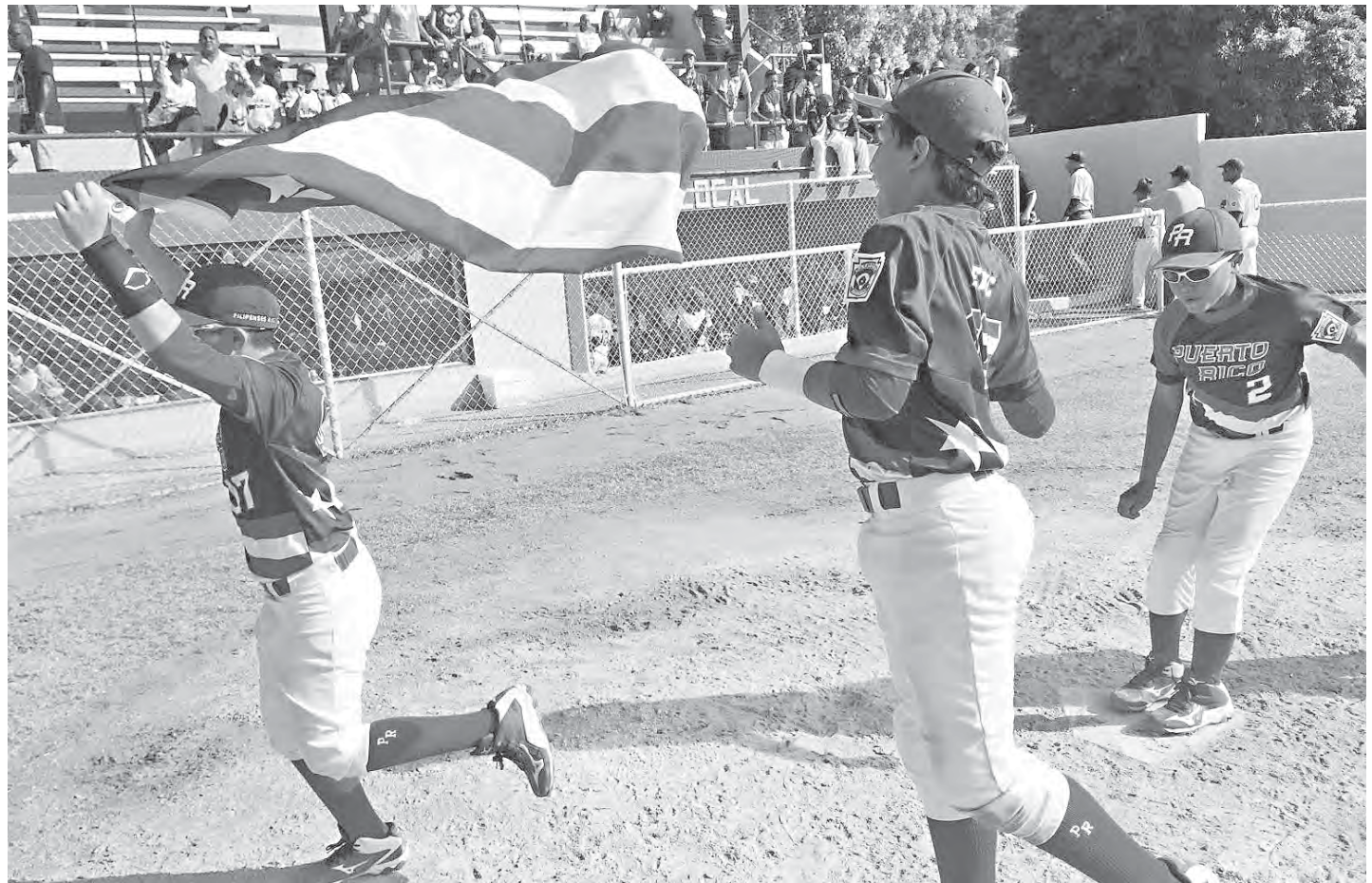
Varios jugadores de Puerto Rico – Guayama pasean La Monoestrellada por el terreno del parque de béisbol Martín Morales Soto de Yabucoa tras ganar el campeonato.

“Estamos todos muy contentos porque todos los sacrificios y esfuerzos fueron claves para el éxito de este torneo. No hay