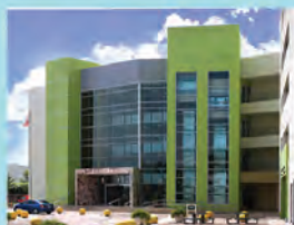
HUMACAO Boulevard del Río