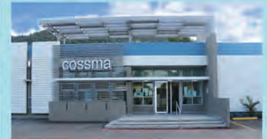
YABUCOA Bo. Juan Martín Carr. 901