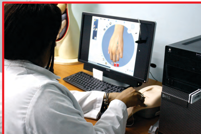
Simulador de canalizador de venas

Humacao Community College es la única institución en el Area Este con un Hospital Simulado Multidisciplinario donde los estudiantes de enfermería y otros programas podrán obtener las competencias necesarias en un ambiente similar al que va a enfrentar cuando salga al mundo laboral. De esta manera el enfermero o enfermera graduado(a) estará altamente calificado, lo cual es necesario y requerido por los patronos del área de la salud.