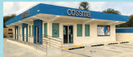
AIBONITO Bo. Robles Carr. 722 Km. 6.4