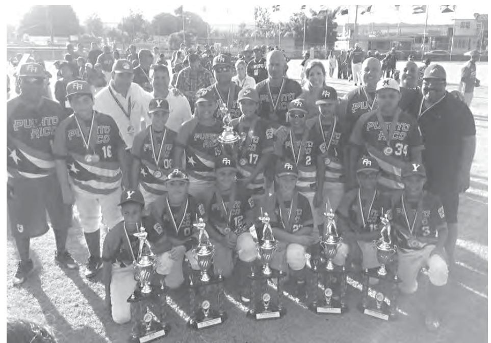
El campeón nacional de Puerto Rico se alzó con el trofeo de la XXI Serie Latinoamericana y del Caribe de Pequeñas Ligas al vencer, 4-3, a Curazao.